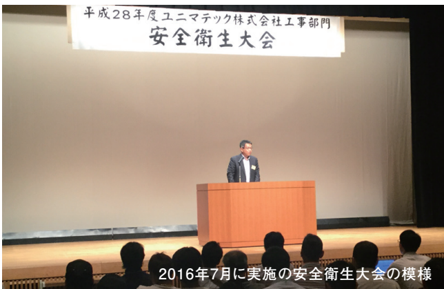
2016年7月に実施の安全衛生大会の様相