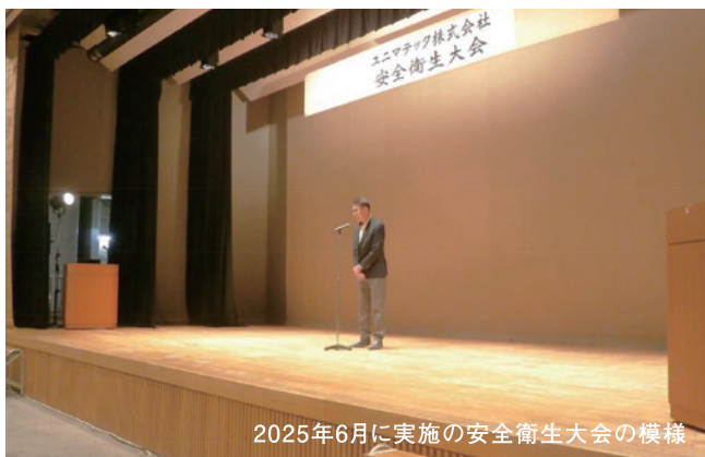
2025年6月に実施の安全衛生大会の様様